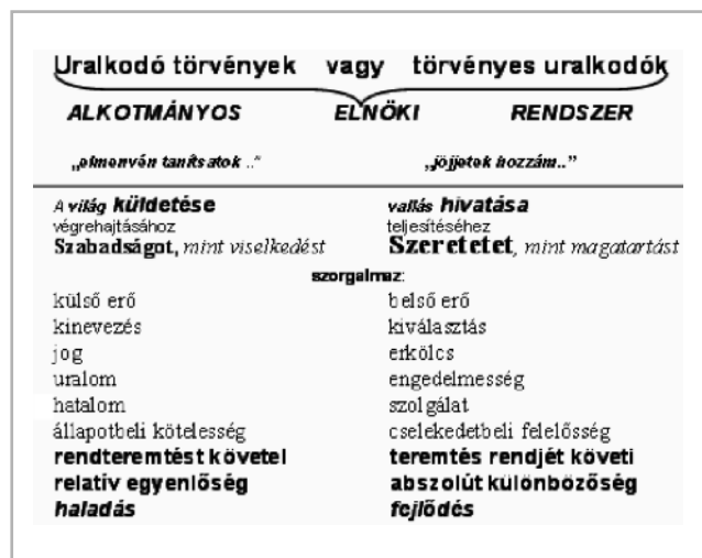
3. ábra Kollektívizmus vagy individualizmus

Az emberi közösségek jól-lét keresésének története – nagy vonalakban összefoglalva – a következőképpen alakult. Az őskorban a létfenntartás kizárólag erő kifejtéssel (nap-hosszat járva-elve gyűjtögetve, majd később erőszakkal, fegyverrel) történt; jellegzetessége, hogy a saját testi szükséglet kielégítésének ára a természetes vagy mesterséges környezet (háborúk) valamiféle pusztítása, amit azután vissza kellett pótolni: földművelés, állattenyésztés, illetve a hadjáratok után újraépítés által. Így a dolgok egymásmellettisége révén, a tér jelentősége került előtérbe, és terület-szerzésben fejeződött ki.