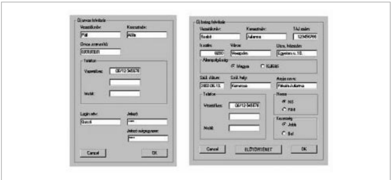
1. ábra Adatbázis – adatfelvételi rész

A HELEN terápiás interaktív teszt és tanító szoftverben a 2. ábrán összefoglalt feladatokat tervezzük (8, Internetről letölthető, 12 vizsgálati feladat). A feladatok csoportosításánál fő szempont, hogy melyek azok a feladat típusok amikhez szükséges a pszichológus (vizsgáló személy) jelenléte és személyes értékelése a gép értékelésén (pontozásán) kívül. Azon feladatok pedig, amiket az egyes vizsgálatok után „házi feladatként” kap a beteg, kerültek az internetes csoportba. Ezeket otthon elvégezheti, gyakorolhat vele, és a legközelebbi vizsgálat alkalmával hozza a gép által értékelt eredményeit, vagy e-mail-en keresztül küldi be a központba. A kö-