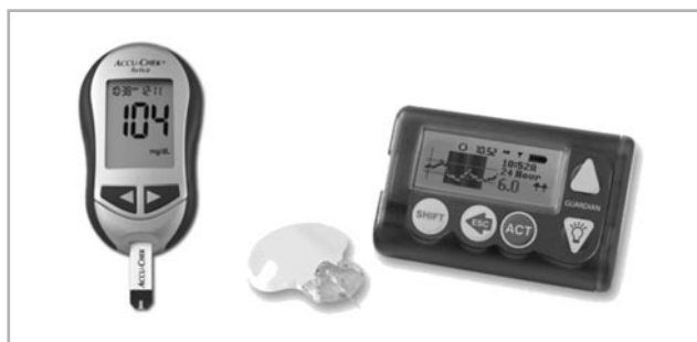
1. ábra Accu-Chek ujjbegyes vércukormérő (A páciens), illetve Medtronic Guardian valós idejű, folyamatos glükóz monitorozó rendszer, 5 perces felbontással (B páciens)

Az A páciens egy hagyományos, ujjbegyes mérőt használt, míg a B páciens egy folyamatos glükóz monitorozó készüléket, mely minden 5. percben mérte a vércukorszintet. Mindkét eszköz hibahatára körülbelül 1 mmol/l (1. ábra).