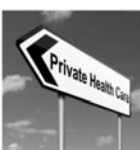
2. ábra A köz és magán lehetséges szerepe az egészségügyi szolgáltatások terén

Az egészségügyben a hozzáférés biztosítása mellett egyre erőteljesebben felértékelődik az ellátás minőségének, az emberi méltóság biztosíthatóságának kérdése, de nem tartozik már az eretnek dolgok közé a differenciált igények kielégíthetőségének a felvetése sem. A differenciált igények, a magasabb szinten elvárt szolgáltatás többletforrás igénye csak nem közfinanszírozott forrásból teremthető elő.