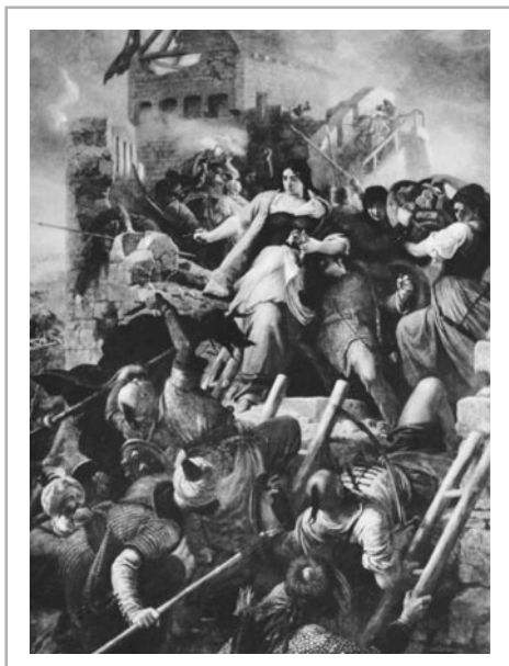
Székely Bertalan: Egeri nők (1867)

Bizonyos mikroorganizmusok (pontosabban bizonyos fajok bizonyos törzsei) rendelkeznek olyan genetikailag meghatározott tulajdonságokkal, amelyek segítségével képesek a gazdaszervezetbe behatolni, ott tovaerjedni, annak különböző célszerveiben megtelepedni és ott olyan folyamatokat végezni, magukból olyan vegyületeket kibocsátani, amelyek hatásaként a gazdaszervezet időlegesen vagy tartósan károsodást szenved. Ez a fertőzés folyamata. Természetesen nem minden kórokozó egyformán virulens, azaz törzsei (egyedei) különböző mértékben termelik a kórokozás faktorait. Természetesen nem egyformán fogékony minden gazdaszervezet a fertőzésre, vagyis egyedei eltérő módon reagálnak ugyanakkora mennyiségű kórokozóval való találkozásra. A fertőző képességet azzal a mikroba mennyiséggel jellemzik, amely a beoltott szervezetben fertőzőes tüneteket alakít ki. Minél virulensebb a kórokozó, átlagosan annál kevesebb sejte is ki tud alakítani fertőzést. Ugyanolyan mennyiségű kórokozó a gazdaszervezet (példának okáért az ember) egyes egyedeit súlyosan megbetegíti, másokat pedig, akik ellenállóak a fertőzéssel szemben egyáltalán nem. Eger várát az erős kapitány, Dobó István megvédte a török támadással szemben 1552-ben, de már a gyenge várkapitány, Nyáry Pál irányítása alatt a lerészegedett zsoldosok nem tudták megvédeni 1596-ban, elesett.