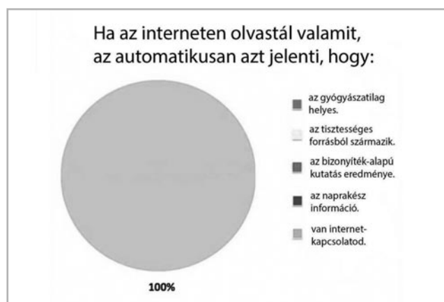
1. ábra Mit jelent, ha olvastunk valamit az interneten?

Mára a világ megváltozott, már bárki bármit kiadhat, sőt: rádiót, tv csatornát működtethet, az információk szakmai hitelességét már senki nem garantálja. Az internet terjedése újabb fejezetet nyitott a tájékoztatásban: a weben már tényleg bárki – pénzügyi, engedélyezési és szakmai korlát nélkül – ellenőrizhetetlenül a világra öntheti gondolatait. Elég egy jó grafikájú honlap, egy ötletes cím, és az információ a hitelesség látszatát kelti, mindez „brit tudósok” által alátámasztva. Akiben nincs egy honlapnyi ambíció, az a közösségi médián terjeszthet bármit. A tájékozódás új jelszava: „a Google a barátod”. De a Google csak azt mondja meg, hogy hol és mit írtak erről, azt nem, hogy mindez igaz-e. A beteg, az egészségét védeni akaró lakos tehát védtelen a rázúduló információtömegetől. A tényhelyzetet az 1. ábra írja le realisan.