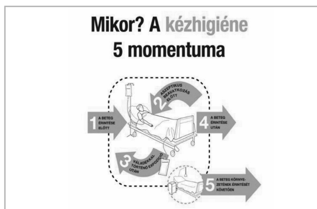
1. ábra A kézhigiéne 5 momentuma. Forrás: [9]

A tárgyi eszközök biztosítása mellett a szemléletváltásra is hangsúlyt fektetünk. Ahogy Prof. Didier Pittet svájci professzor, az alkoholos kézfertőtlenítés atyja is gyakran fogalmaz, a kézfertőtlenítés olyan, mint a biztonsági öv az autókban. Hiába van ott, hiába tudja mindenki, hogy be kellene kötni, hiába csak egy mozdulat, mégis nagyon sokan nem használják. Az intézkedéseknek számos támadásponton kell beavatkozniuk a siker érdekében. Az emberek gondolkodását kell megváltoztatni, és ez a legnehezebb. Hiába tesszük elérhetővé minden ponton az alkoholos fertőtlenítőt, ha nem használják azt. Az igazi kihívás a szemléletváltásban rejlik, annak elérésében, hogy az ellátók a napi gyakorlatban betartsák a kézhigiéne 5 momentumát (1. ábra).