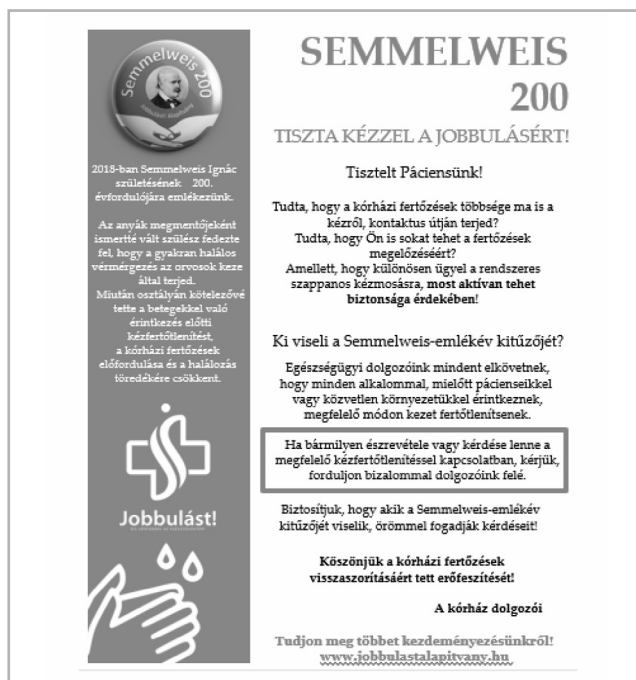
3. ábra A Jobbulást! Alapítvány betegtájékoztató plakátja

A nyitóeseményt követően az Alapítvány vállalati és lakossági adománygyűjtésbe kezdett. A befolyó tárgyi és anyagi támogatások segítségével számos további kórházba szeretnénk eljutni. Azt reméljük, hogy az intézmények menedzsmentje mindenhol nyitottan fogadja a kezdeményezést, így közös erőfeszítéssel javíthatjuk a kézhigiéne gyakorlatot, ezáltal a megbízhatóságot. Emellett remélhetőleg a napokban nyilvánosságra hozott és ősszel bevezetendő miniszteri rendelet, miszerint "Az egészségügyi szolgáltatóknak biztosítania kell – az osztályok profiljához igazodóan – az alkoholos kézfertőtlenítő szer, valamint a kézfertőtlenítő szer adagolók elérhetőségét minden betegellátási ponton, valamint a látogatói belépési pontokon", mielőbbi megvalósítását is hatékonyan tudja majd segíteni.