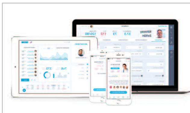
Intuitív medikai információs rendszer

Az Asseco Group a szoftverek gyártására és fejlesztésére specializálódott, átfogó, saját fejlesztésű IT-szoftvermegoldásokat kínál a gazdaság minden ágazatára. Természetesen ez a háttér, ez az „építkező szellemiség” bennünket is inspirál, így mi is létrehoztunk egy Innovációs Tudásközpontot (ITK), jelenleg több mint 50 kollégánk dolgozik két, az egészségügyi üzletág számára fontos projektjen: egyrészt egy folyamat vezérelt döntéstámogatási rendszeren, másrészt egy protokoll-, és adatvezérelt járóbeteg informatikai rendszer megvalósításán tevékenykedünk. Jövőbemutató és ügyfeleink miatt fontos volt egy az e-számlázás lehetőségének megteremtését lehetővé tévő fejlesztésünk is, ezen a spanyol EDICOM céggel dolgoztunk együtt. Itthon ügyfeleink körében a CompuTREND-del összefogva közösen biztosítjuk ezt a szolgáltatást.