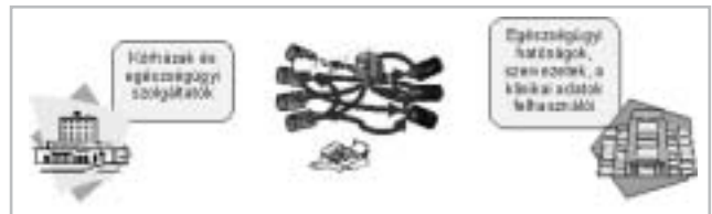
1. ábra Az információ továbbítás jelenlegi helyzete

(pl. e-mail). Ilyen módon van kapcsolat az OEP és az egészségügyi hatóságok felé is (1. ábra).