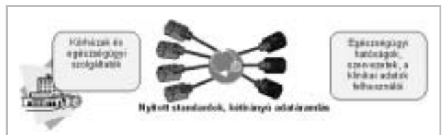
2. ábra Rendezett, irányított adatállomány

Az egészségügyi adatok továbbítására a HCN egy adat-szolgáltató-adatfelhasználó rendszert (publisher-subscriber system) alkot. Az adatszolgáltatók (kórházak, rendelő intézetek, laboratóriumok stb.) továbbítják a hatóságoknak a szükséges információt. A felügyeleti szervek és az országos intézetek a kapott információkból tudnak monitorozni, egészségügyi folyamatokat felismerni. Ebben a rendszerben egy másik kórház, amely adatért fordul a rendszerhez, természetesen szintén adatfelhasználónak minősül.