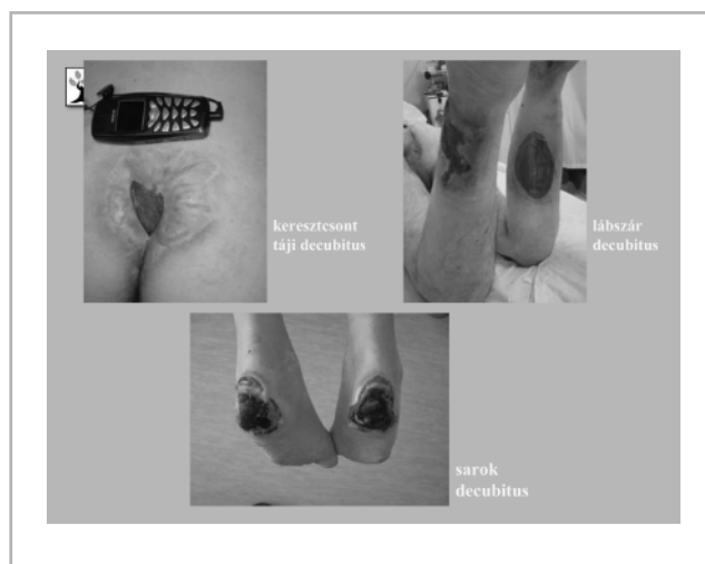
1. ábra Az OORI-ba átvett, máshol rehabilitált betegek fotói

Ha most a makroszintről leereszkedünk a betegek szintjére, szintén szomorú a kép: mint a progresszivitás csúcsán levő intézmény, az Országos Orvosi Rehabilitációs Intézet sok helyről kap beteget, amelyeket más rehabilitációs intézetben kezeltek. Az 1. ábrán néhány képet szeretnék bemutatni elrettentésképpen olyan betegekről, akiket emelt szorzójú osztályon rehabilitáltak (?!).