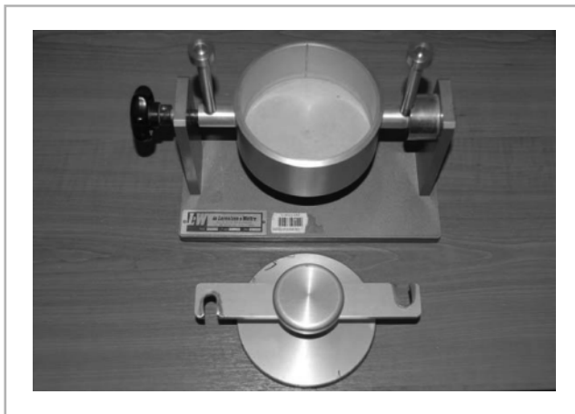
1. ábra A felületi nedvességfelszívó képesség vizsgáló eszköze

cia betét felület mekkora mennyiségű mesterséges vizeletet képes az idő függvényében befogadni. Ehhez a vizsgálat-hoz felhasználjuk a papíriparban szokásosan alkalmazott és szabványosított „felületi vízfelvevő képesség (Cobb test)” és MSZ EN ISO ide vonatkozó szabványát. A vizsgáló készülék az 1. ábrán látható.