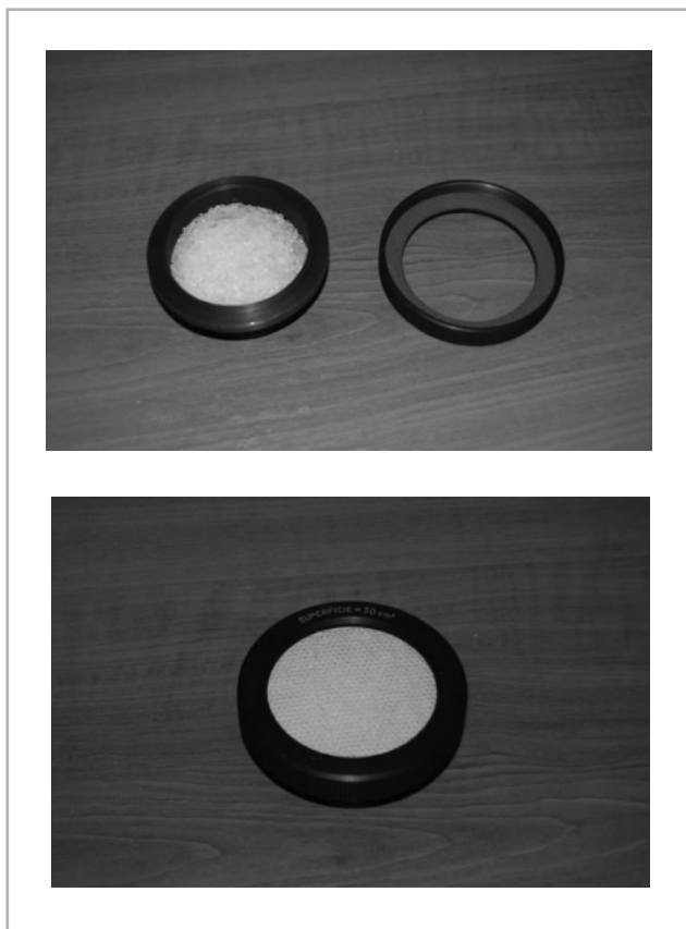
4. ábra A mesterséges vizeletből származó „vígőzáteresztő képesség” mérésére szolgáló készülék

Egy-egy típus esetén természetesen mérés technikai okokból több mintát kell vizsgálni, hogy az esetleges eltérések is értékelhetők legyenek. A mérési eljárást kipróbáltuk kereskedelmi forgalomban kapható termékekre is, azért, hogy mérési eljárásunk helyességét igazoljuk. Próbáink alapján úgy tűnt, hogy mindkét vizsgálati eljárásra tíz-tíz mintadarab elegendő.