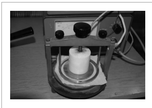
3. ábra A felület nedvességtartalmának mérése villamos ellenállásmérés alapján

A mérés során nagyon fontos, hogy a készülék teteje oly mértékben le legyen rögzítve, hogy folyadék csak a befogott felületre hasson. A készülék típusa ezt egyébként lehetővé teszi.